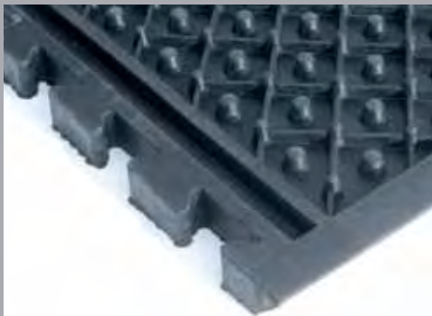
FLORA Unterseite FLORA bottom view

A 30 mm thick, soft and durable mat made of premium natural rubber with a double layered body. A strong and animal friendly hammer-scaled surface spares the joints of the animals by using a balanced friction resistance. High comfort is achieved by the 3 stepped rear side of soft rubber. Interlocking connections on all borders result in a continuous easy to clean surface. By using a combination of 115 cm and 125 cm wide mats all sizes of cubicles can be covered quickly and easily.