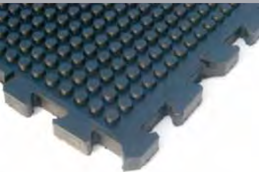
LAGAMA Unterseite LAGAMA bottom view

A 20 mm thick rubber mat with the non slip Mabogrip-surface and burls on the rear side provides a secure and hoof friendly floor cover for the walkway. The border and the interlocking connections in full material thickness result in a firm join and allows installation to be done without additional fasteners.